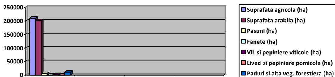
Fig. 2 - Repartizarea fondului funciar

In graficul de mai jos, este reprezentata repartizarea fondului funciar la nivelul teritoriului acoperit de GAL BARAGANUL de SUD -EST acesta fiind alcatuit din 84.55 % suprafata agricola, 81.04% suprafata arabila, pasuni 2.60 %, fanete 0.079 %, vii si pepiniere viticole 0.80 %, livezi si pepiniere pomicele 0.020 % iar padurile se regasesc pe o suprafata de 4.34 % din totalul suprafetei teritoriului.